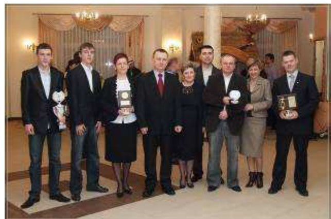
Pamiątkowe zdjęcie z II Gminnej Gali Mistrzów Sportu