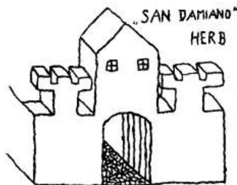
Herb San Damiano