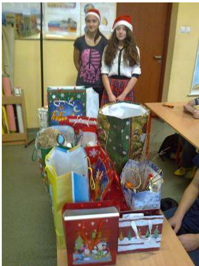
Mikołajki w klasie Ia