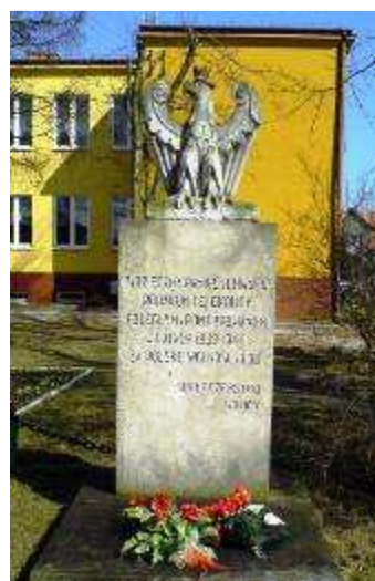
Pomnik na placu Szkoły Podstawowej w Wolicy.