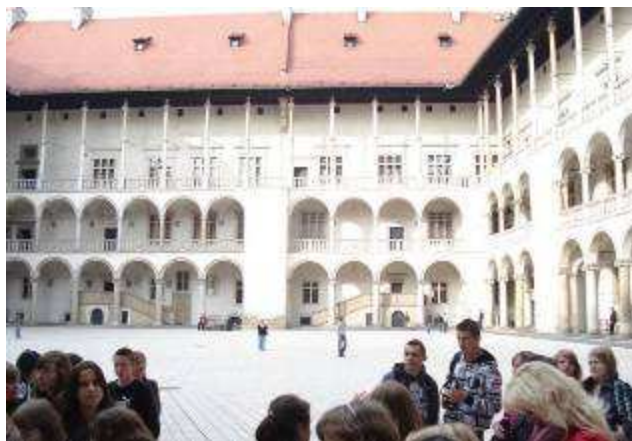
Wspomnienia z wycieczki: Uczestnicy wycieczki na dziedzińcu Zamku Królewskiego w Krakowie.