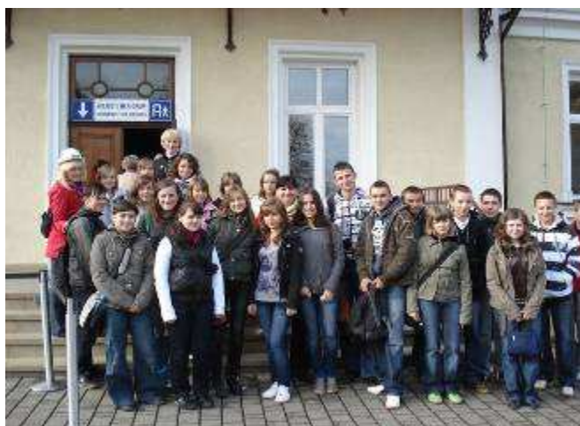
Wspomnienia z wycieczki: Uczestnicy wycieczki przed wejściem do Kopalni soli w Wieliczce.