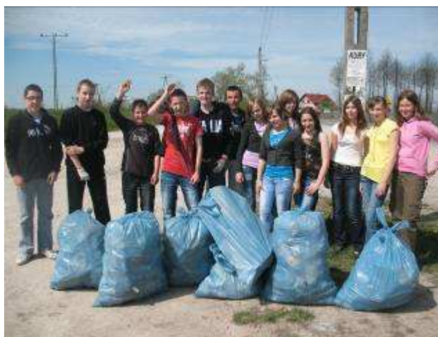
Klasa Ib prezentuje „zebrane żniwo” podczas akcji „Sprzątanie świata”.