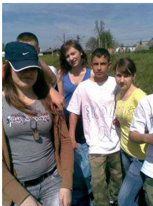
Uczniowie kl. I Ib podczas akcji „Sprzątanie świata”.