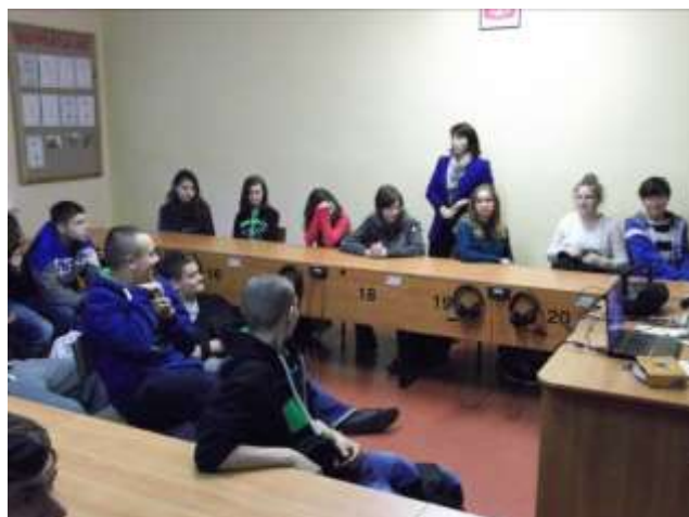
Uczniowie klas: IIIa i IIIb oglądają spektakl „Antygona”