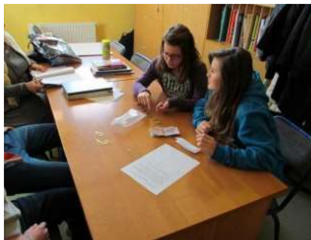
Samorząd Szkolny podsumował zbiórkę pieniędzy dla niepełnosprawnego kolegi.