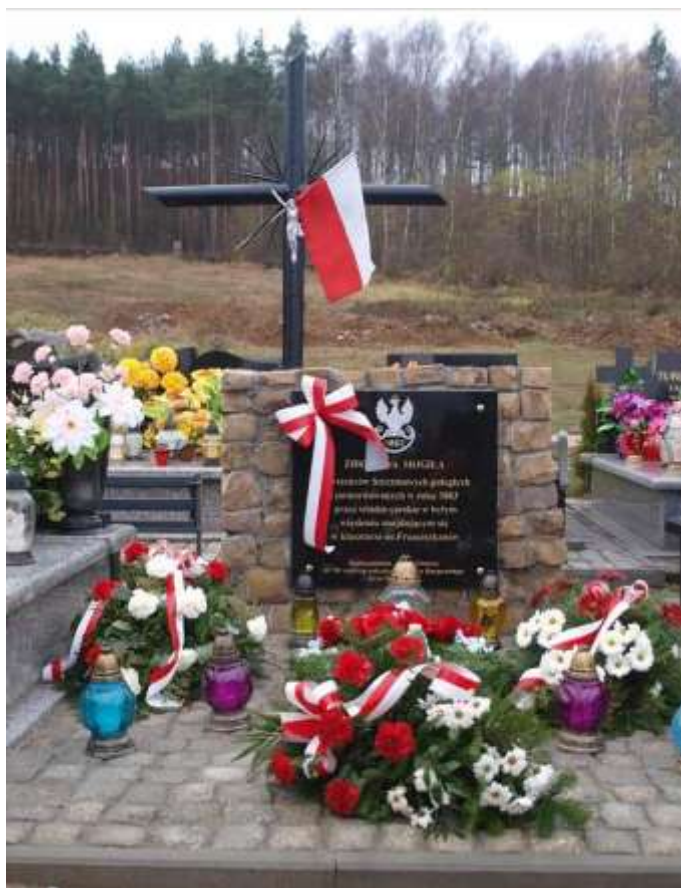
Zbiorowa mogiła Powstańców Styczniowych na cmentarzu parafialnym w Chęcinach.