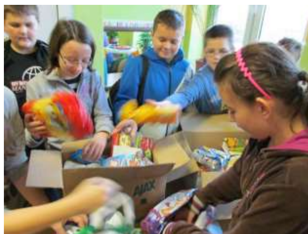
Uczniowie SP podczas zbiórki darów dla niepełnosprawnego kolegi.