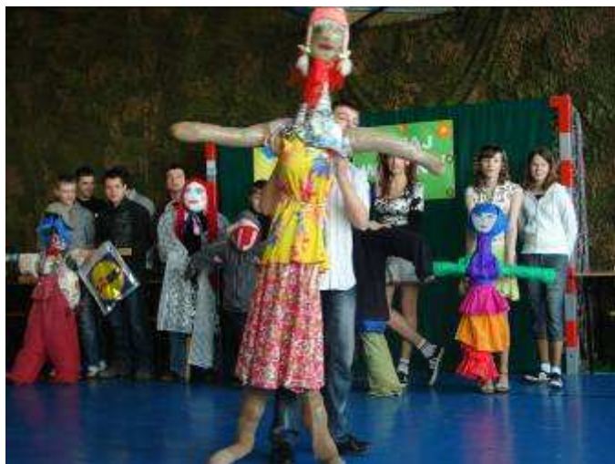
Najpiękniejsza marzanna wykonana przez kl. IIc.