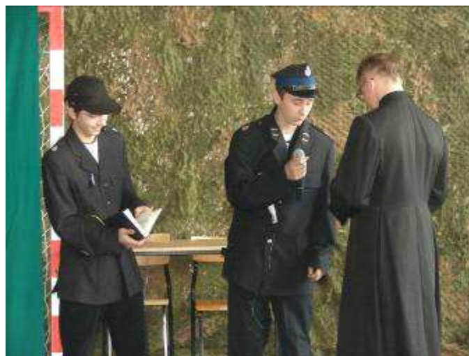
Oj będzie mandacik..., kl. IIIa w scenie kabaretowej.