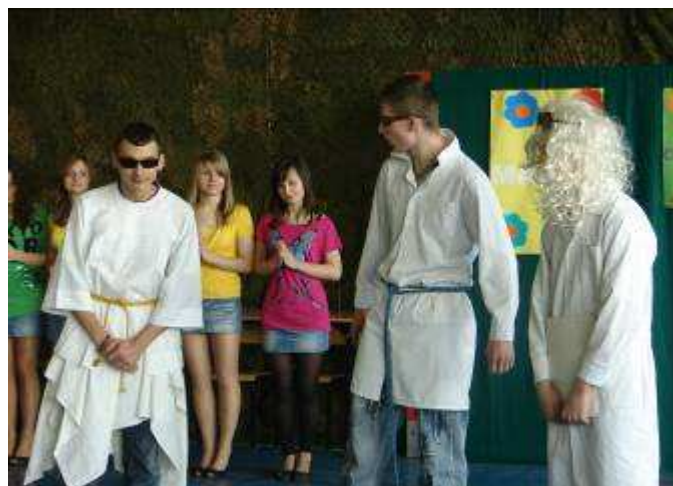
Kabaret „Niebo –Piekło” prezentuje kl. IIc.