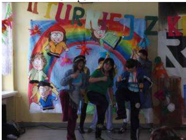
Mini festiwal KARAOKE- uczniowie podczas wykonywania piosenki „Wiosna, wiosna...”.