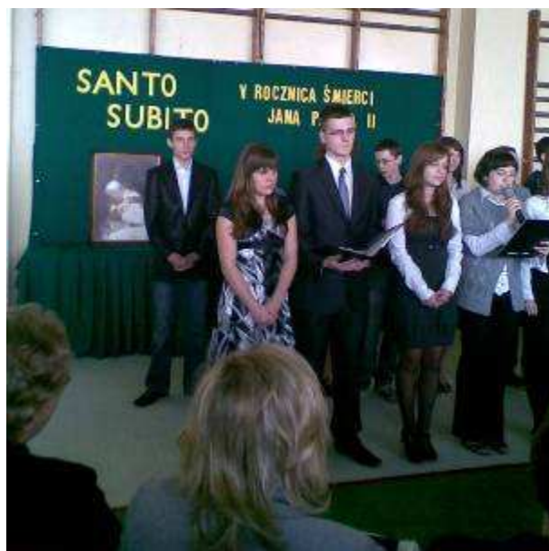
Uczniowie wspominają pontyfikat Jana Pawła II.