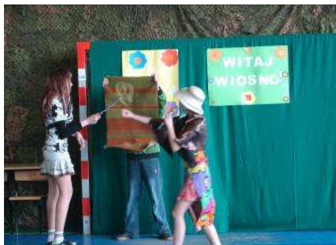
„Trzepała Zośka dywan, z dywanu leciał kurz...” Wiosenne porządki w wykonaniu kl. IIa.