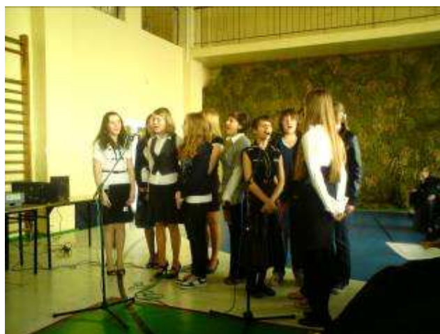
Chór szkolny śpiewa dla Papieża „Barkę”