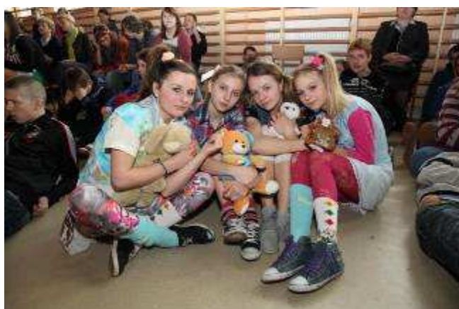
Fot. Magda Cieślakiewicz, kl. IIIa p. Krzysztof Taborski