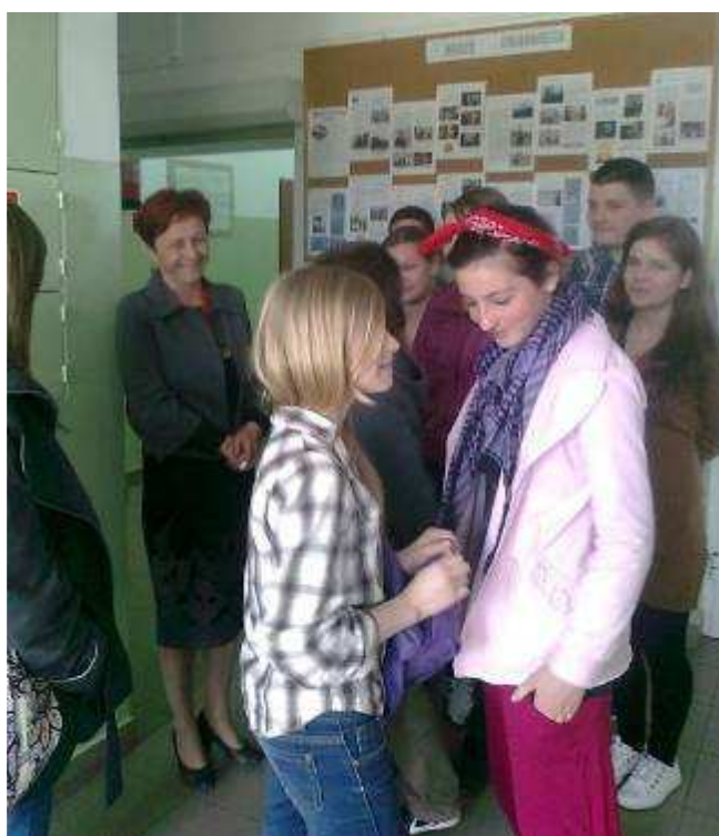
Szóstoklasiści z Tokarni podczas wizyty w naszym gimnazjum.