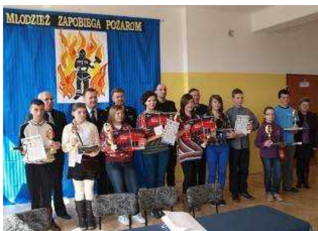
Etap gminny konkursu „Młodzież zapobiega pożarom”