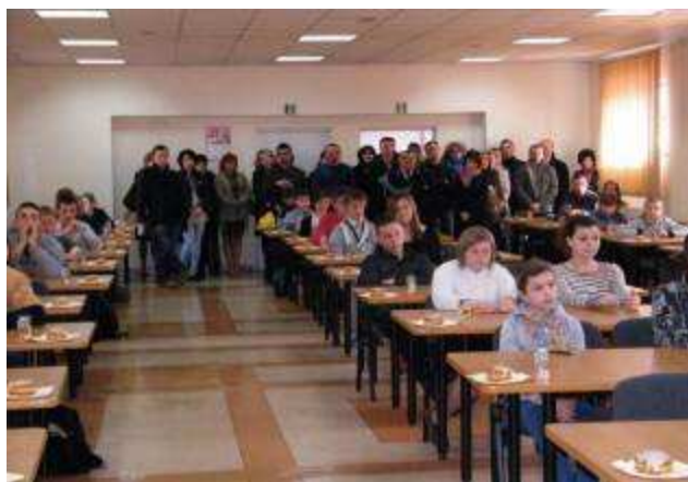
Finał powiatowy konkursu „Młodzież zapobiega pożarom”