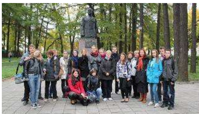
Uczestnicy projektu: uczniowie z Rygi, Moskwy i Wolicy.