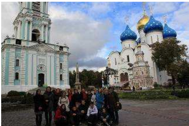
Najstarsza Ławra w Rosji w Siergiej-Posad. Wraz z naszą grupą delegacja z Łotwy.