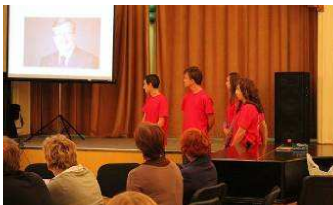
Uczniowie naszej szkoły przedstawiają prezentację o naszym kraju, gminie i szkole.