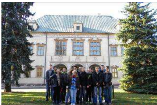
Klasa IIa przed Muzeum Narodowym w Kielcach.

W założenia Roku Szkoły z Pasją wpisuje się także kolejna z inicjatyw podjętych przez wychowawcę i uczniów wspomnianej klasy, a mianowicie udział w zajęciach organizowanych przez Muzeum Narodowe w Kielcach. „Lekcje muzealne” to godzinne obcowanie ze sztuką: malarstwem, rzeźbą, grafiką. Uczniowie mogą z bliska przyjrzeć się temu, o czym uczą się na lekcjach języka polskiego, historii i sztuki. W czasie pierwszej wizyty w Muzeum klasa zwiedziła sale muzealne poświęcone historii obiektu na przestrzeni wieków, od momentu powstania do chwili obecnej. Mogła zapoznać się z dziełami epoki baroku, w której pałac powstał. Uczniowie zwiedzili również sale w których zebrano dzieła malarskie od czasów baroku, po czasy współczesne, między innymi dzieła Stanisława Wyspiańskiego, Jacka Malczewskiego, Olgi Boznańskiej czy Witkacego. Z racji przypadającej 11 listopada rocznicy Odzyskania przez Polskę Niepodległości młodzież zwiedziła również ekspozycję poświęconą Marszałkowi Józefowi Piłsudskiemu.