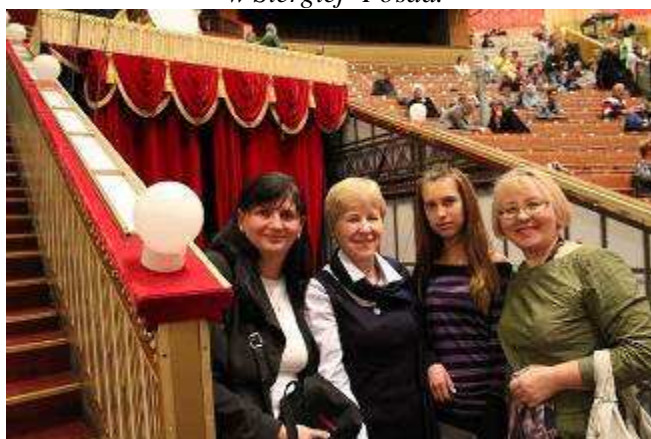
W Cyrku Buff – największym w Moskwie i Rosji.