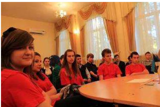
Obrady okrągłego stołu w gimnazjum (nasi uczniowie w koszulkach Akademii Dziecięcej Dyplomacji).