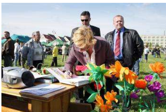
Wicewojewoda Świętokrzyski Beata Oczkowicz wpisuje się do kroniki naszej szkoły.