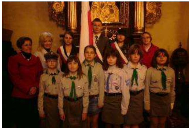
Delegacja ZSO w Wolicy w Kościele pod wezwaniem św. Bartłomieja w Chęcinach dumnie reprezentuje szkołę.