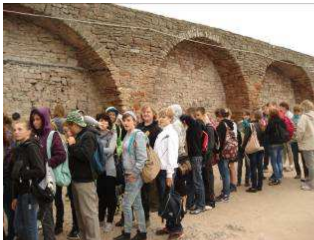
Aby dostać się na wieżę zamkową trzeba stać w długiej kolejce.