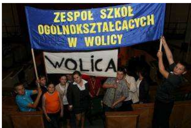
Młodzież ZSO z Wolicy na Gali Belfer Roku 2010/2011