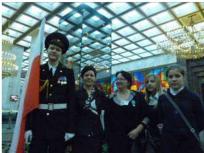
W Muzeum Sławy Wojskowej po uroczystym apelu.