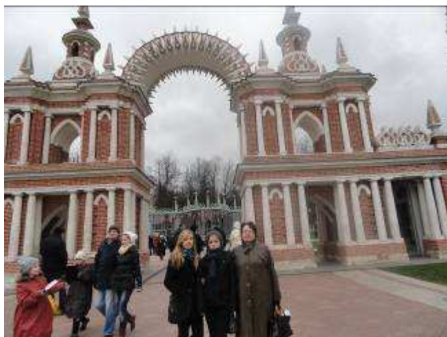
Przed pałacem Katarzyny II w Carycynie.