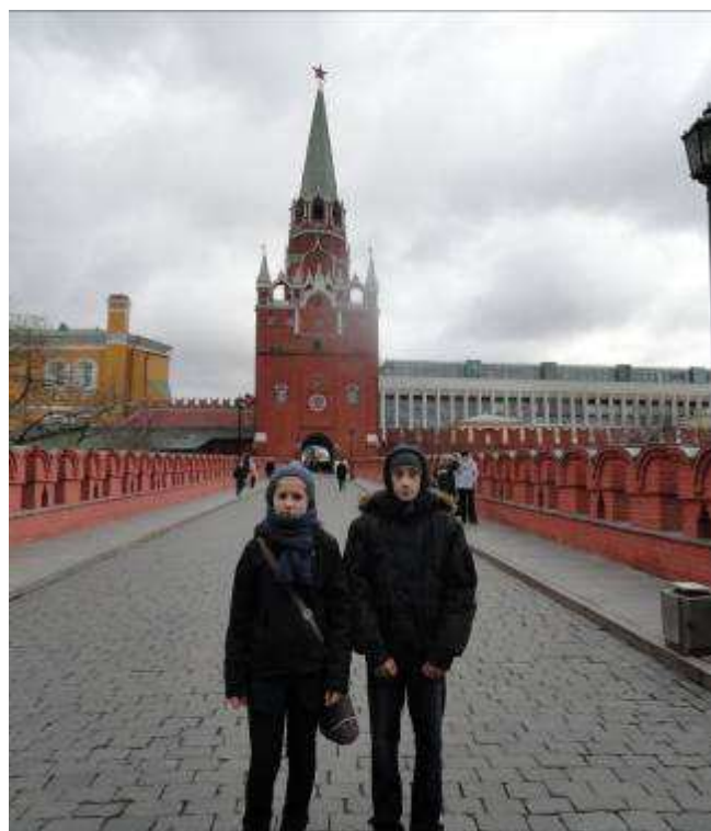
Przed wycieczką do Kremla.