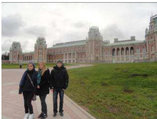
Pałac w Carycynie.