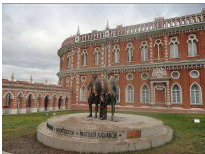
Pałac w Carycynie.