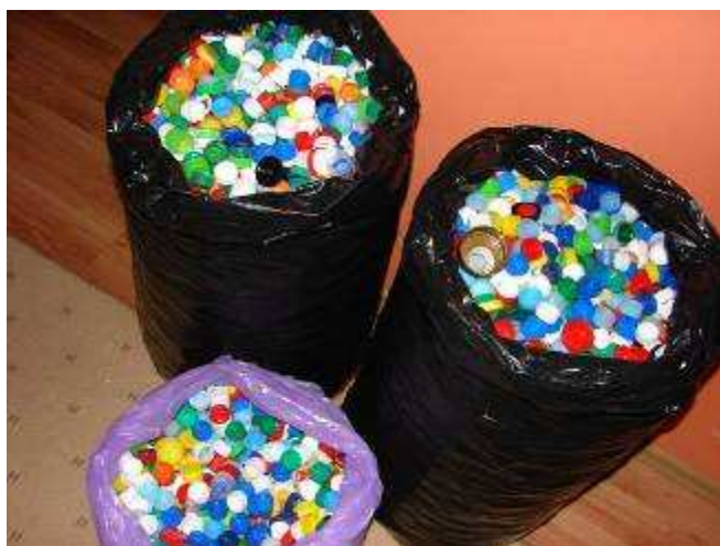
Zakrętki zebrane w miesiącach IX – XI 2010 w naszym gimnazjum.

Bardzo dziękujemy za wasze wsparcie i wielkie serce!