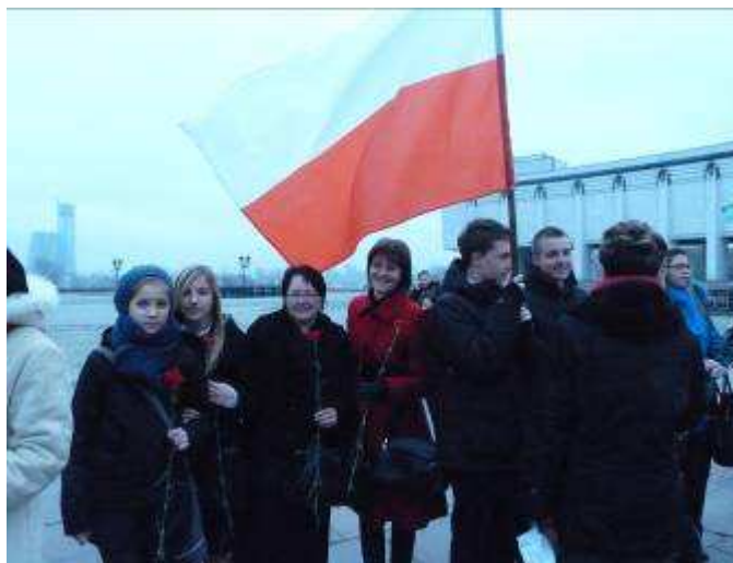
Na Pokłonnej Górze