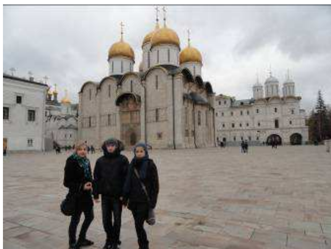
Na placu świątyni Kremlowskich.