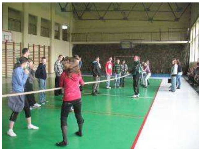
Konkurencja sportowa – przeciąganie liny - dziewczęta.

Dzień Sportu Szkolnego był integralną częścią akcji profilaktycznej „Zachowaj Trzeźwy Umysł” .