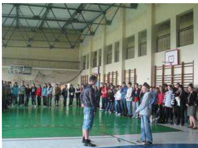
Konkurencja sportowa: przeciąganie liny - chłopcy.

Opracowanie: Rafał Gajos i Agnieszka Gajos.