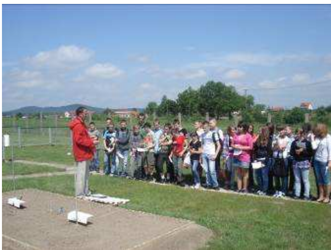
Uczniowie obserwują pomiar temperatury gruntu.