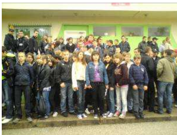
Jedziemy do kina...

Opracowanie: Klub Miłośników Geografii i SU