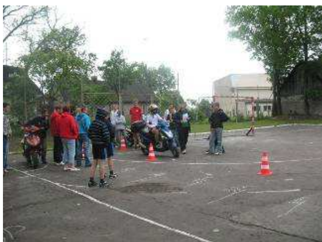
Egzamin praktyczny na kartę motorowerową.

Tego dnia, w obecności funkcjonariusza Policji, odbył się również egzamin praktyczny na kartę rowerową i motocyklową.