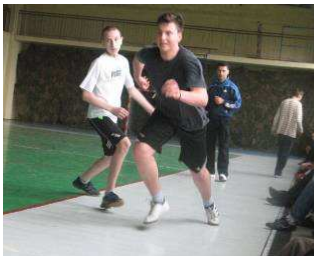
Mały turniej piłki nożnej.