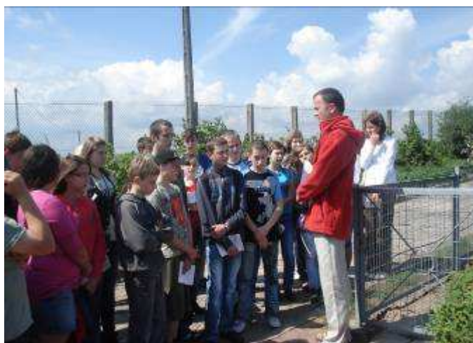
Uczniowie przed wejściem do ogródka meteorologicznego.