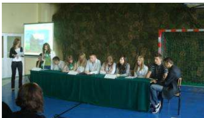
Uczniowie na konferencji prasowej poświęconej zanieczyszczeniu powietrza.

Z okazji Dnia Ziemi oraz Święta Niezapominajki klasa II c i Klub Miłośników Geografii przygotowały przedstawienie, które odbyło się 19.05.2010 r.