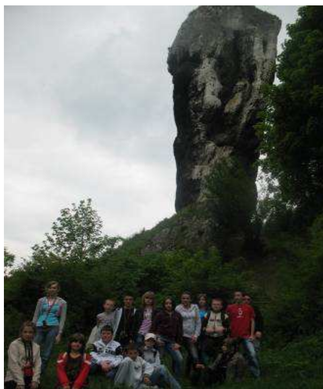
Uczestnicy wycieczki pod Maczugą Herkulesa.

Wszyscy uczestnicy wycieczki, napili się magicznej wody ze źródła miłości i młodości.