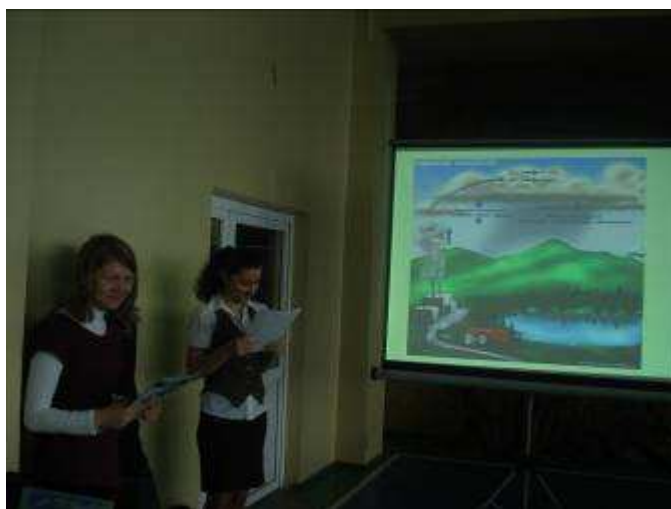
Prezentacja powstawania kwaśnych deszczy.