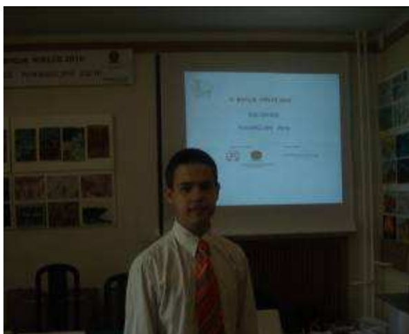
Hubert Kwiecień przed odebraniem nagrody.