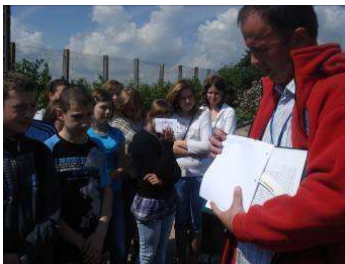
Kierownik prezentuje sposób szyfrowania meldunków pogodowych.