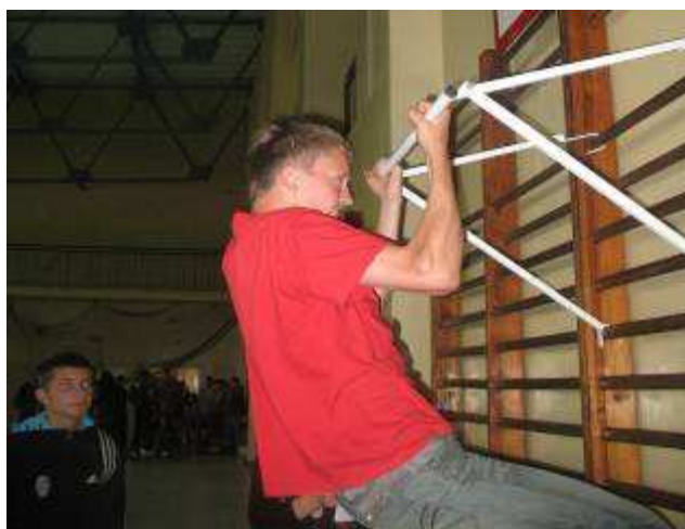
Konkurencja sportowa: podciąganie na drążku - chłopcy.