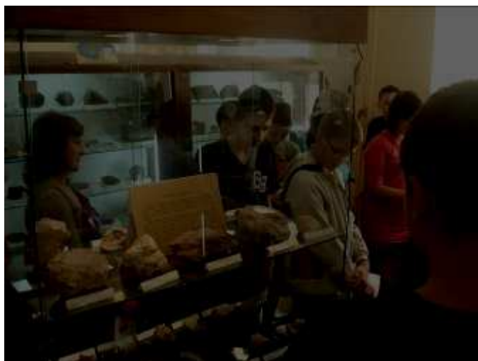
W czasie lekcji uczniowie oglądali niespotykane okazy skał.