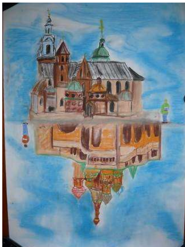
Agnieszka Piwowar, klasa Ia