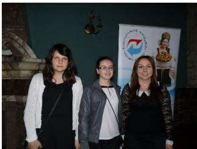
Uczestniczki konkursu „Poezja i Proza na Wschód od Bugu”.