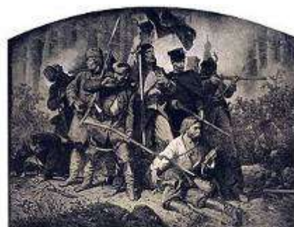
Artur Grottger, Bitwa, grafika z cyklu Polonia, 1863