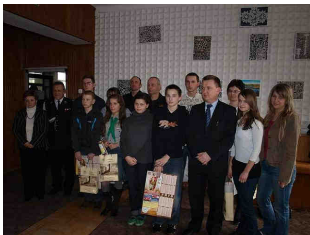
Pamiątkowe zdjęcie z konkursu.

[ 1 ] Gminny portal internetowy - Chęciny